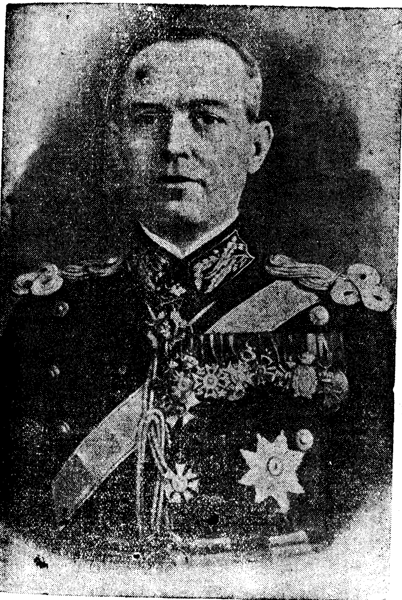
General ION ANTONESCU

Conducătorul Statului și Președintele Consiliului