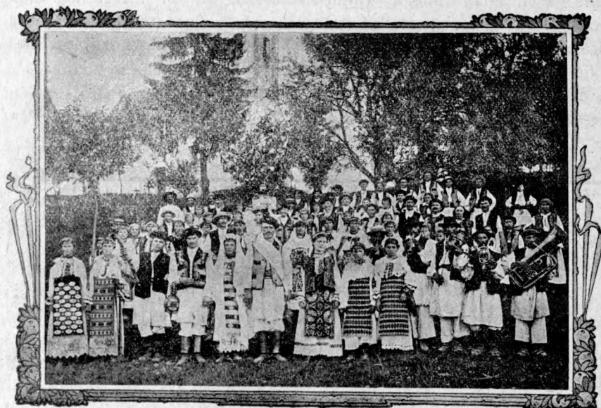
Nuntă românească din Bouțar, (com. Hunedoarei).