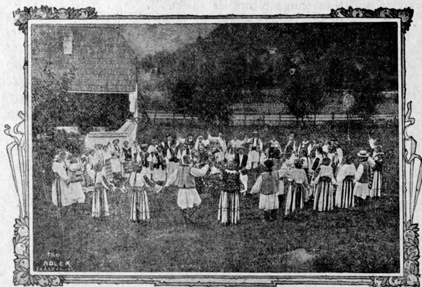
«Hora» jucată de nuntași în Bouțar (com. Hunedoarei).