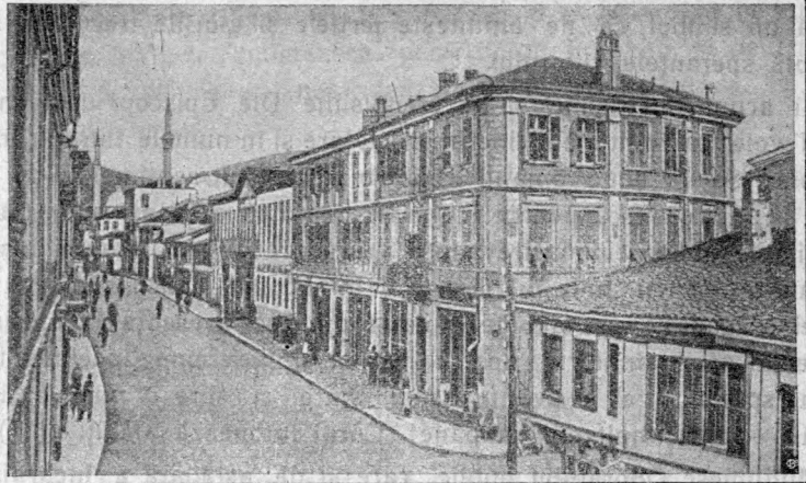
Strada principală din Monastir.