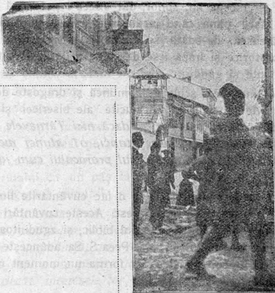
Scenă de stradă în Monastir. (Clopotnița capei, române).