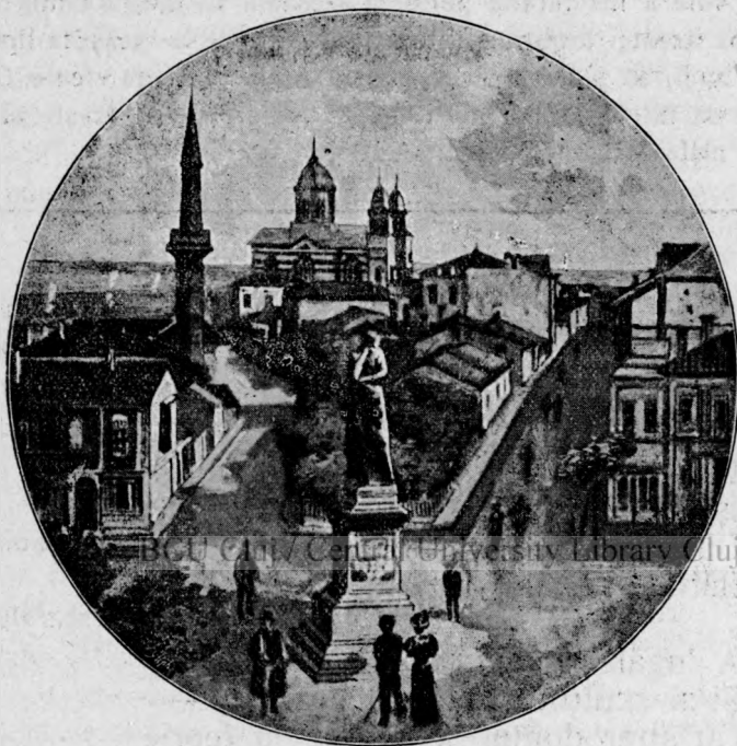
Piața Independenței în Constanța.

dar aceste cadre istorice poartă viața frumoasă nu le poate nici ignora, nici evita. Madame Woelfling și ortacele ei nu ne vor fi ideale. Ele locuiesc în colibi de lut, în sinul pământului, în găuri săpate, nu se pieptenă, nu schimbă albituri, și se aseamănă cu vechi eremiți, pe din afară, adevărat, numai pe din afară, și astfel pe noi nici de cum nu ne pot atrage. Elementul istoric nu-i permis să-l neso-