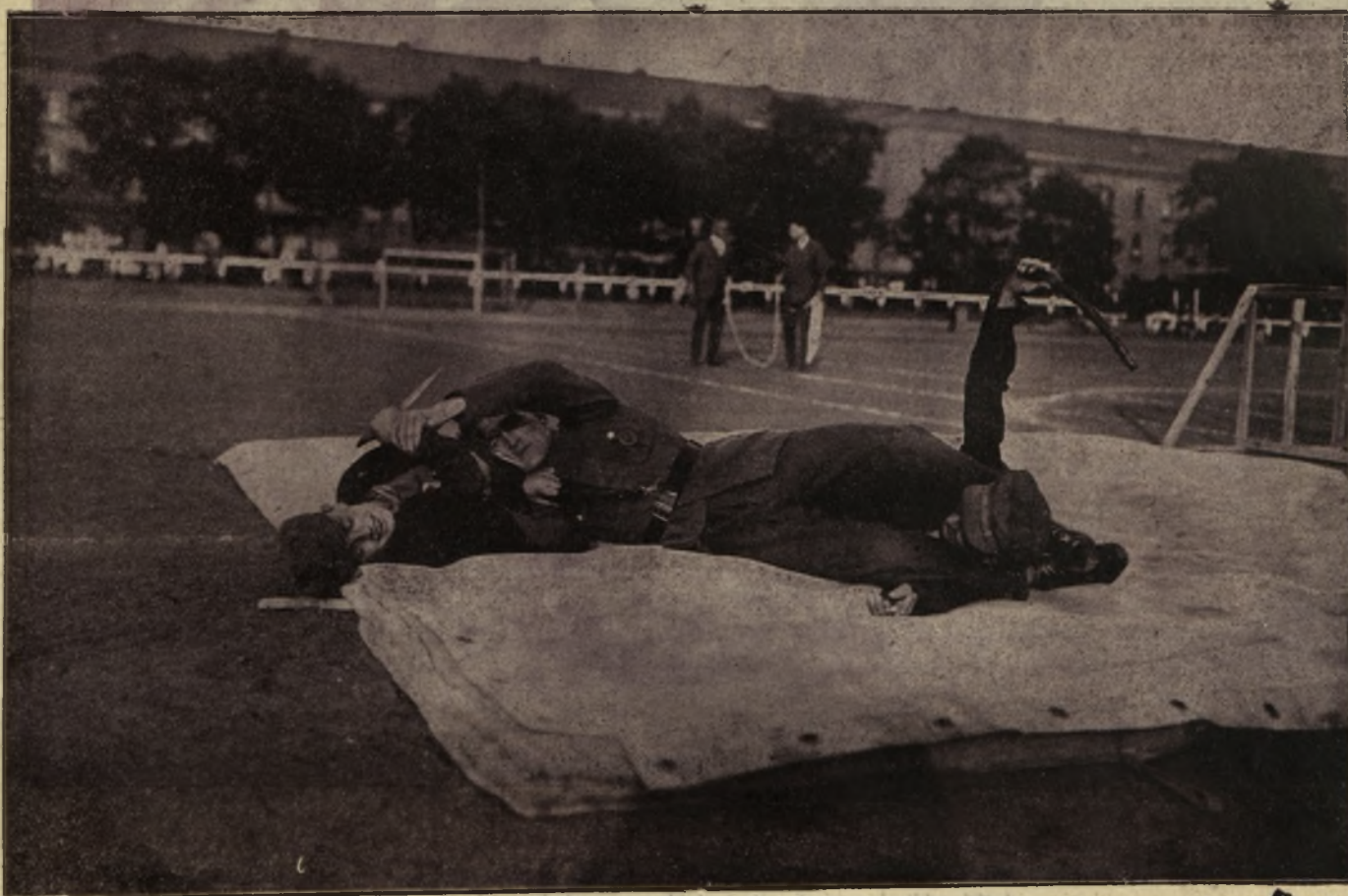
În străinătate sportul nu este neglijat în poliție. Boxa, jiu-jitsu și lupta atletică sunt apanagele indispensabile ale unui bun polițist. Se