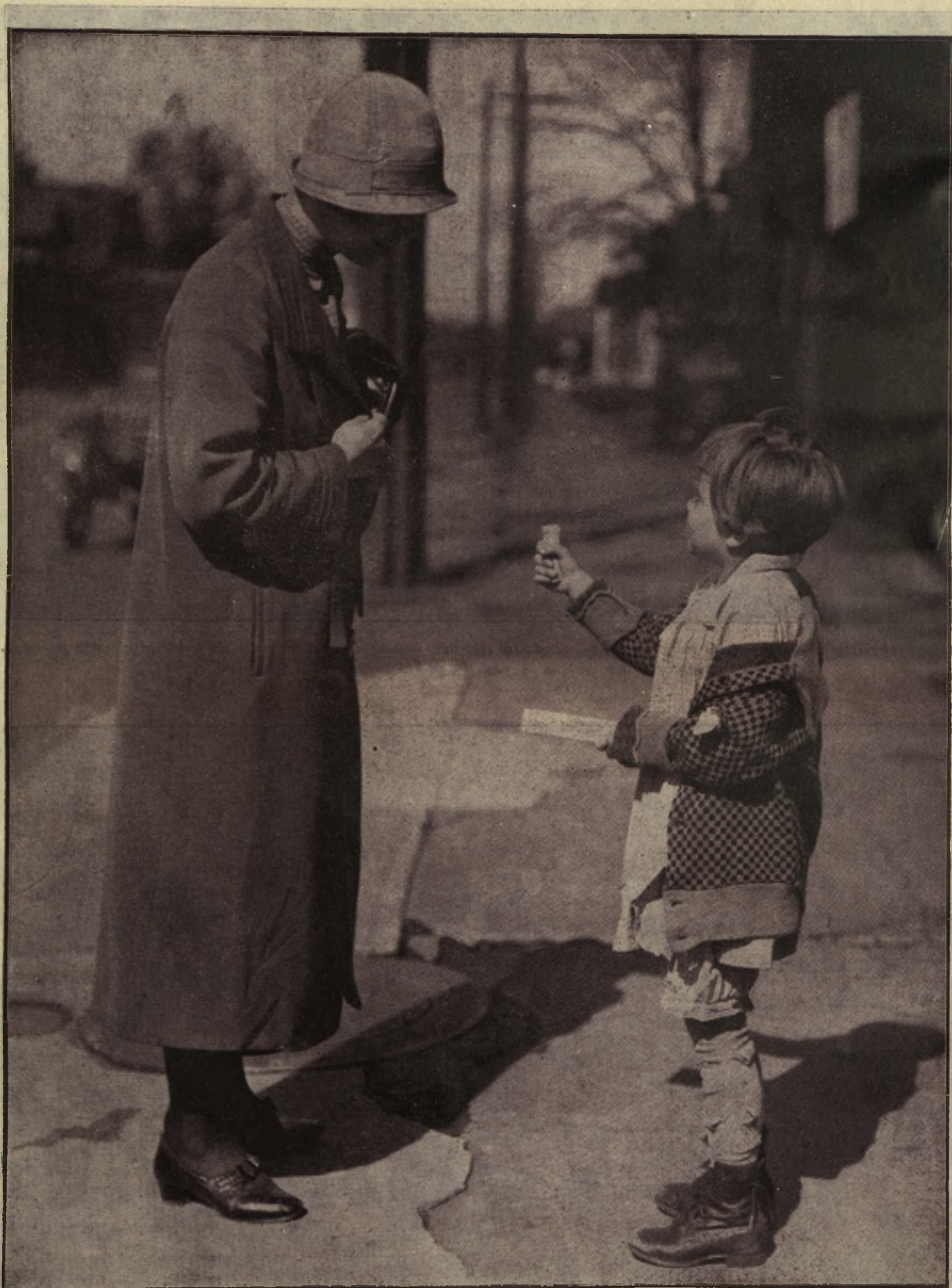
Poliția feminină din Washington se interesează de relațiunile familiare ale unei micuțe vânzătoare... clandestine, care e trimisă pe stradă să-și câștige pâinea, contravenție pedepsită de legile de acolo.