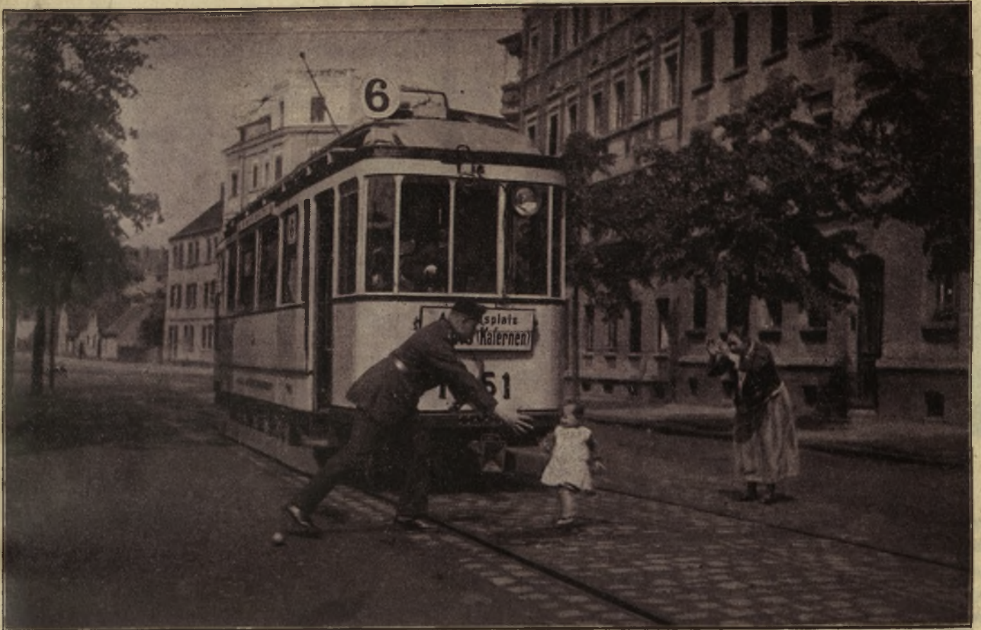
Sergentul german apără într'adevăr viața cetățenilor... Instaneul reprezintă o scenă drăgușă din multiplele îndatoriri ale unui sergent... și ilustrează cu prisosință grija pe care el o poartă pentru micuții — cetățeni...