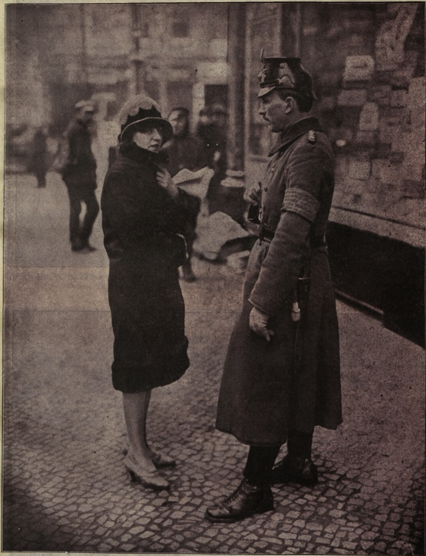
In străinătate agenții de circulație cari vorbesc mai multe limbi poartă pe mână o placardă, pe care sunt indicate limbile ce vorbesc. Astfel publicul se poate orienta într'un oraș străin, ca la el acasă.