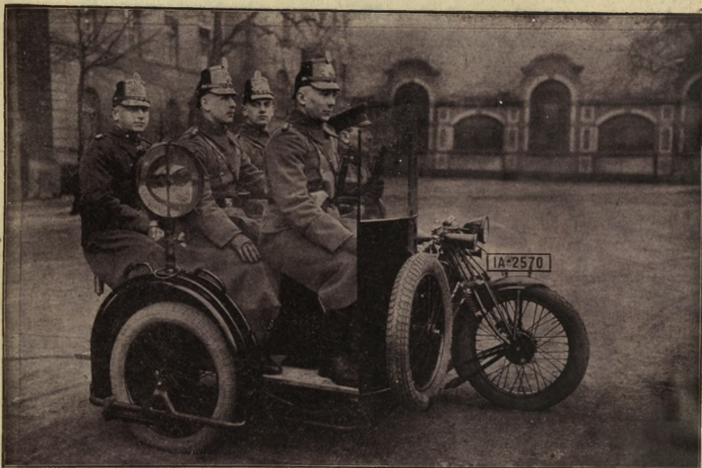
Politia germană se echipează după ultimele cerințe moderne, și vedem astfel sus, o așa zisă „echipă volantă” de polițiști, pe o motocicletă combinată, care e prevăzută și cu mitralieră și servește pentru urmărirea bandiților periculoși.