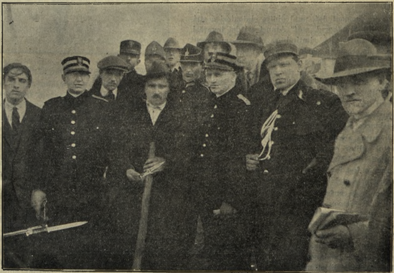
Asasinul după desgroparea cuțitului criminal, pe care-l predă poliției, înconjurat de anchetatori.