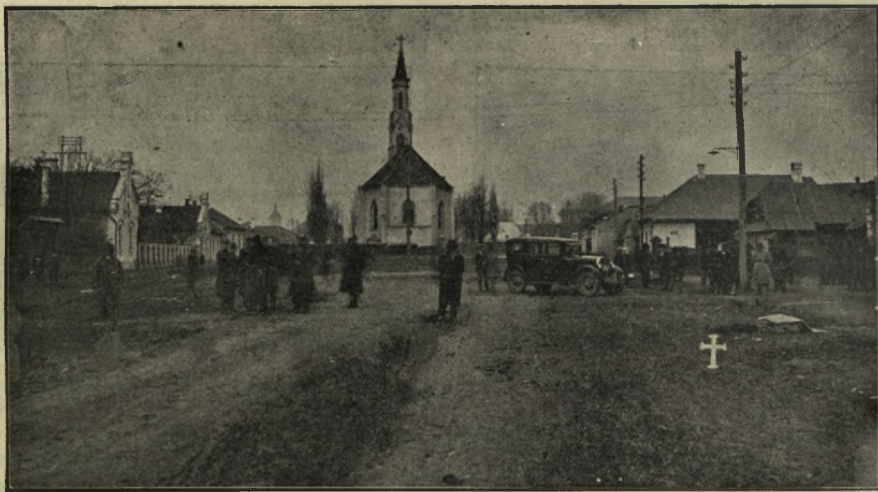
Teatrul crimei. In fund biserica Sf. Petru din Calea Victoriei. Locul unde a fost găsit cadavrul este însemnat cu o cruce.

Intre timp poliția pornise cercetări discrete și pentru descoperirea celor doi civili misterioși, cari