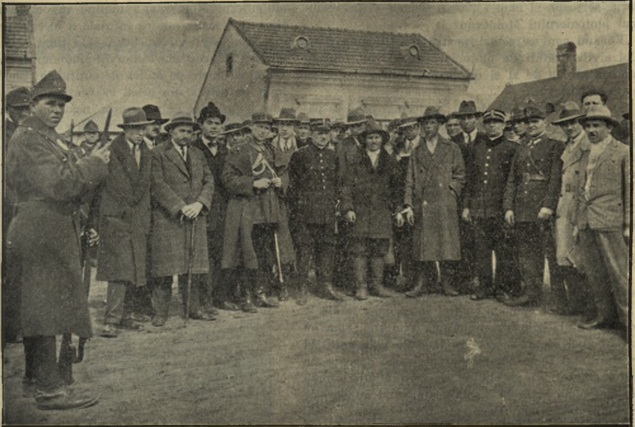
Reconstituirea crimei. Poliția judiciară la fața locului, împreună cu asasinii și un imens public, așteaptă sosirea comisiunei.