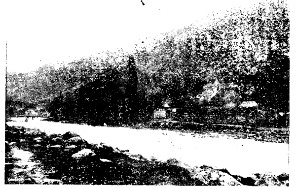
Someșul la Sângeorzul românesc.