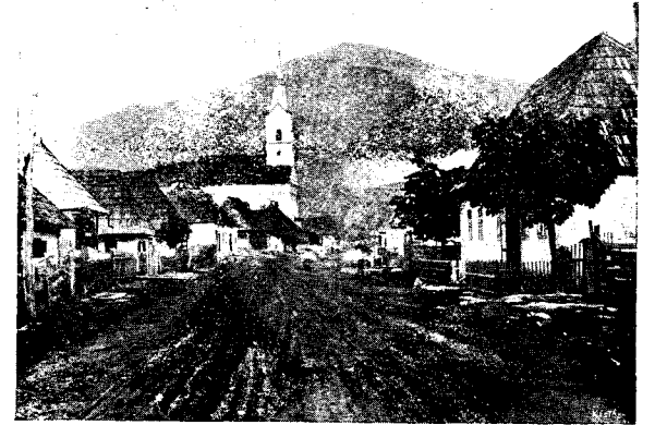
Strada principală și biserica.

archiva Metropoliei dela Blaj, toate împrejurările adevărate din cari a răsărit biserica lui Bob în Cluj. Destul însă a amintit, că Episcopul cu bună inspirație a zidit aceasta biserică atunci, la 1803, când în Cluj nu erau decât 80 de suflete de Români greco-catolici, în total 15—20 familii. Si eată că acest frumușel locaș D-zeesc s'a făcut un bun răsad de sămînțe, un bun seminariu, că azi sunt aproape 5000 de suflete numai credincioșii cari se țin de aceasta parohie, nesocotind pe frații noștri din Mănăstur, nici pe cei gr.-or. Și dacă toți aceștia țin, prin legăturile puternice ale sfintei biserici la legea noastră, este a se mulțami numai alduitei inspirațiuni alui Bob, de a le face lor locaș dumnezeesc, în jurul căruia să se poată grupa.