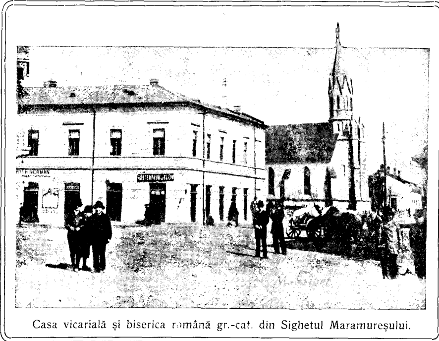
Casa vicarială și biserica română gr.-cat. din Sighetul Maramureșului.

Limba, scrisă și grăită, e cea mai puternică copcie a acestei închiegări. Chieșășia viețuirii noastre ca neam îndelungat în zile, ne-o dă poporul de jos, cu iscusința lui trează la lucruri și cu dragostea de glia și de așezămintele ce le are. Dascăli ai acestui norod ne-întocmit și nevêrstnic încă la minte suntem noi, cărturarii. Dela vrednicia și dela hârnicia noastră atîrnă soarta bună sau rea ce ni-e rënduită.