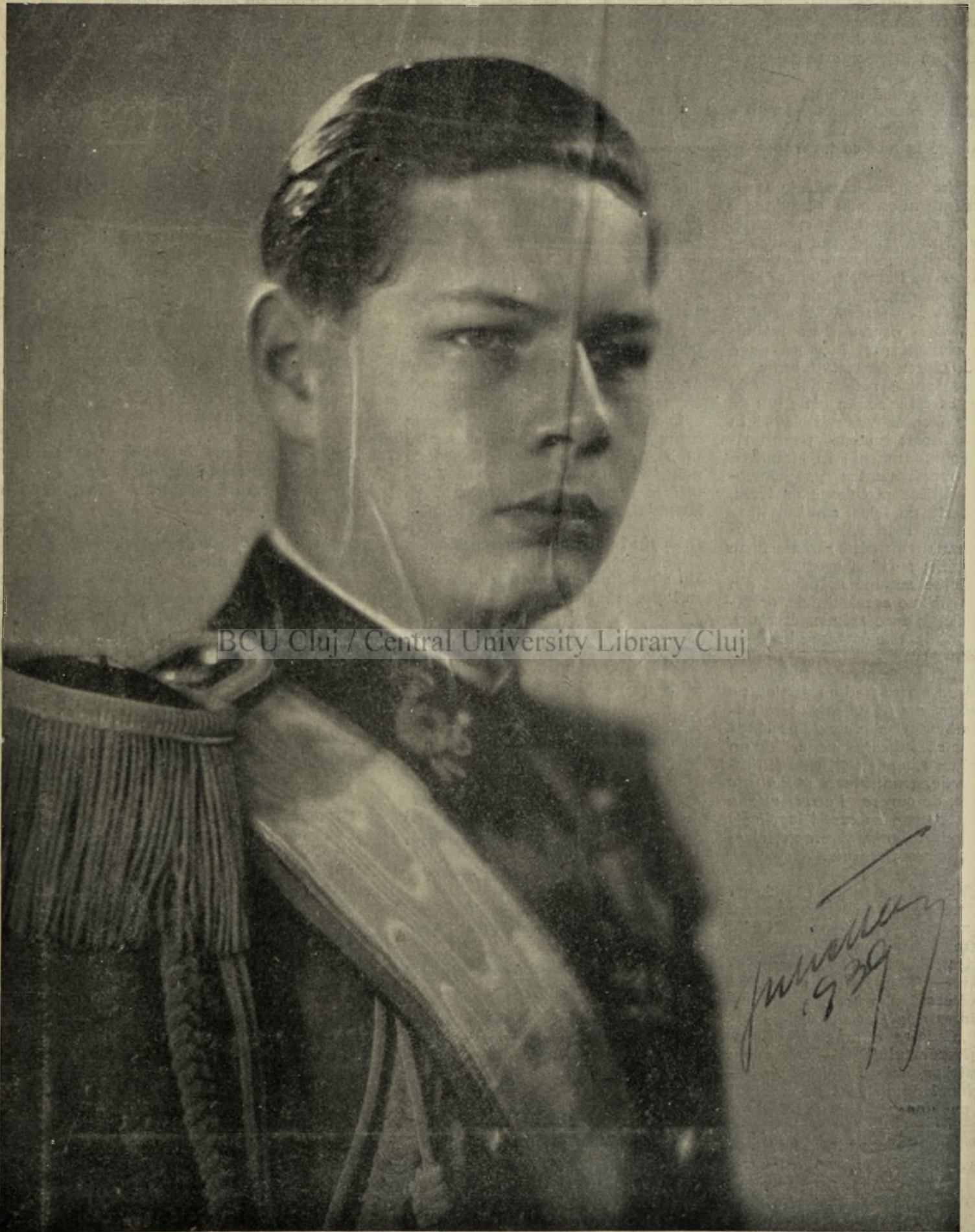
MAJESTATEA SA REGELE MIHAI I.