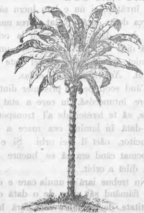
2. Cărmălu (II Regnul vegetal).