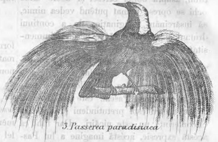
3. Passera paradisiaca (III Regnul animal).