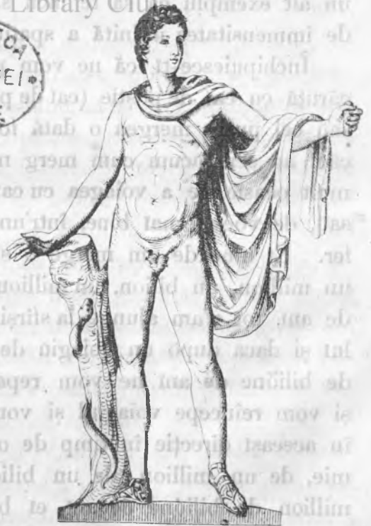
4. Apollon. (IV Regnul human sau moral sau social).

Amabile cititor, fi-vei ore dispus de a (linisteste-te) nu va ține mult? Et bine, face împreună cu mine o excusiune depăr- ia-mă de mână și urmăde-mă. tată, foarte depărtată te însciunțel dar care Să ne suim pe înălțimea unui munte