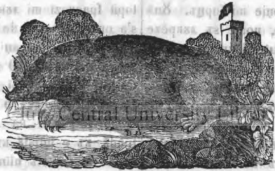
1. Шоаречеле дін касѣ (Mus Musculus).

Шоарічеле (Mus) este знѣ анималѣ мікѣ, foarte ңентілѣ ші foarte poditorѣ (Aristotel zиче кѣ а възстѣ кѣ дінтр'о переке де шоаречі, а ешітѣ în кѣрссѣлѣ де 7 лѣні, 150 нсі); sінтѣ foarte sfіічіоші; аѣ о кодіцѣ сѣзціре нѣроасѣ ші паркѣ аконепите кѣ солдѣрї ші d'о foormѣ парлікѣларѣ (коада шорічѣлѣлѣ, е веслітѣ pentрѣ forma sa); канѣлѣ лорѣ este askѣцітѣ; аз нѣмаі 4 оінці тѣіоші ші ките tpeі мѣселе în дреанта ші stінга dar кѣ ачеші нѣціні дінці мѣнінкѣ маі мѣлѣ де кітѣ поі кѣ 32 че'ї авемѣ Сѣ гѣсескѣ пе кімпѣрї, în пѣдѣрї ші în каселе оамені-лорѣ; нѣтемѣ сѣ зичемѣ кѣ домѣнѣлѣ шоаречілорѣ este лѣмеа întreарѣ. Sінтѣ omnішоаре адекѣ мѣнінкѣ тоате лѣкрѣрїле че гѣсескѣ: піне, фїніѣ, хайнеде, тоате веде-талеле, тоате кѣрнѣрїе ші кеарѣ талѣ де чїзме; дарѣ се ші мѣнінкѣ знѣ пе алѣ.