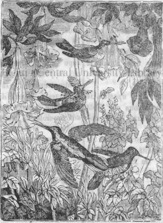
Насѣрѣ Colibri ѣн Амерѣка.

Natрѣѣ ѣи плаче es- tremele, ка ши поѣ оа- menѣлорѣ. Ынтѣкмаѣ кѣ ѣнтре оаменѣ Локѣиторѣ пѣмѣнтѣлѣтѣ, зпѣтѣ маѣ марѣ ши алѣѣтѣ маѣ мѣчѣ; ва ѣнкѣ, зпѣтѣ преа марѣ ши алѣѣтѣ преа мѣчѣ; аша ши ѣнтре насеѣрѣ ло- кѣиторѣ аерълѣтѣ, зпелѣ сѣнт foarte марѣ ши алѣтѣ foarte мѣчѣ. Esemплѣ д'а- ѣестѣ доѣ estremе. не даѣ доѣ насеѣрѣ кѣре ле пре- зентѣмѣ аѣѣ ѣн доѣ фирѣрѣ, аѣекѣ stpsus ши ко.ѣѣрѣ . Am авѣтѣ okazѣне а ворѣ де-пѣре Istoria Natрѣралѣ аѣесторѣ доѣ насеѣрѣ, де fie-кѣре деосѣѣтѣ, акѣмѣ ѣнсѣ вошѣ фѣче о ком- парѣциѣне ѣнтре аѣестѣ доѣ estreme, ѣн клѣса насе- рѣлорѣ.