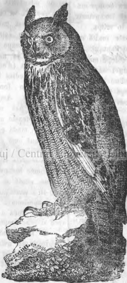
Boală de noante (Strix bubo.)

Boală de noante se întrevîncează și la prînderea țioriloră, întokmai ka șoimăș nențră prînderea altoră pîzări; dară nșmai kindă sîntă țineri poate serbi la achestă skopă și kear atînci vîntoră care le prînde, țrebe să aibă o mare vîgare de seamă ka s'î țale mai nainte vîfșă țiareloră, kîci almintrelea poate să se întîmpe vr'o nenorocire.