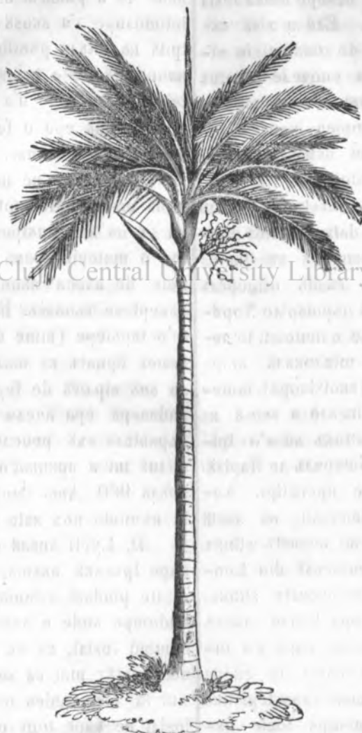
I. Палмиерулă Arecca.

Палмиериле (kăрталеле) ađ esistată năkă la deată-nălă denulă omană. La chei mai antici năplă din orientă, палмиереле ađ жkătă polăлă chei mai impoptantă nainte mi de ană. Sakra Skriptura este plăt de lășda și de folosulă loră. Devora șvedea mi жădeka năplă sș zăbra znei palmiere. Profeta merindă în desepț, s'a nătrită năma de kărtале. Kămă este nentă noi pînea ză osiekă trebzinčiosă din toate zilēle. Acheastă impreușkare a pămasă și akămă în birōpe în toită orientă; kăči orientă are în sine nărtiklară, prinčipulă konserbatismă; toată fizionomia orientă și kare a avăto nainte mi de ană, o are și akămă; kon-