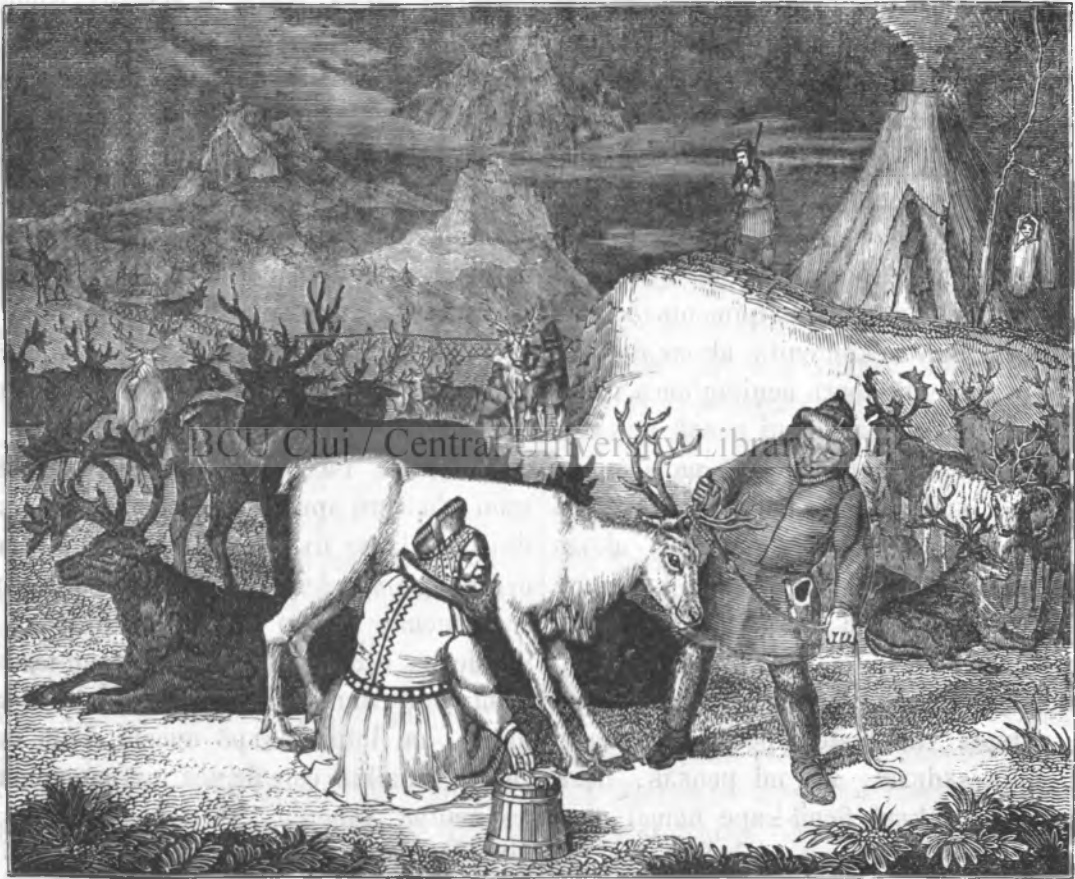
Червълъ ренѣ ( cervus tarandus ) ін Лапонїа.

Червълъ ренѣ окъпъ ін історїа натъралъ о позиџїсне іntермедїаръ іntре червълъ по-