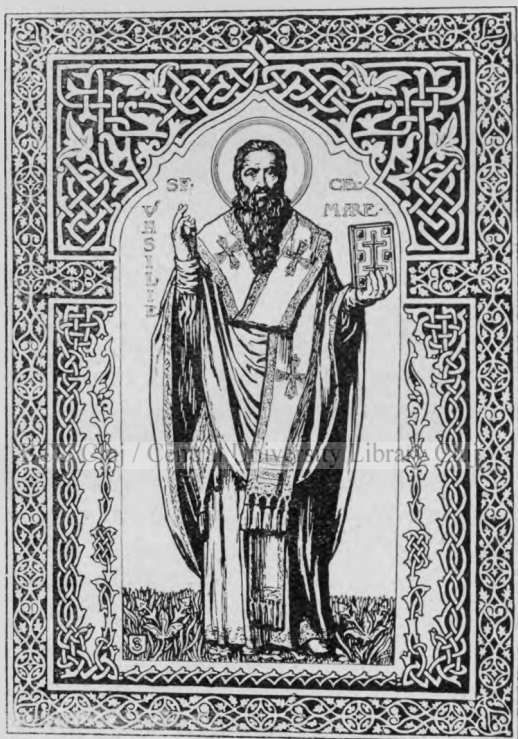
Sfântul Vasile Cel Mare Patronul Liceului din Blaj