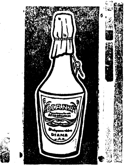
Cetii și răspândiți: „Gazeta Transilvaniei”

Aceasta din motivul, că oficiul postal, din ordinul lui știmpul, până azi e reținut în mod abuziv, toată corespondența cuprinzând adeziunile din Sibiu, Blaj, Alba-Iulia și alte centre din Ardeal. Întrucât și instituțiile publice din România, obișnuit fac jocul guvernelor, provocând prin aceasta serioase perturbațiuni la mecanismul Statului, transmitem ce dorim și reținând ce nu le convine, vom fi nevoiți să recurgem la mijloacele de comunicații medievale, la poștașii și curieri, spre onoarea civilizației contemporane.