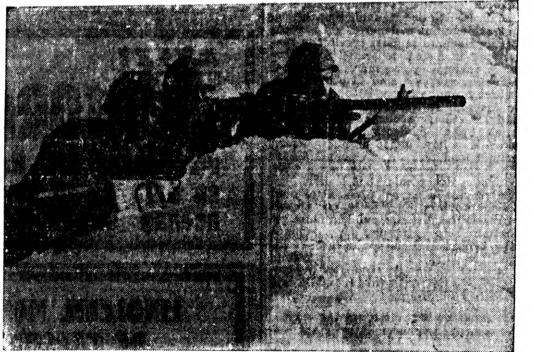
Soldați alpini italieni pe frontul din Albania. Un post avansat de mitraliori.

bucurie la gândul că nava arzând este inamică. Nu vă pot spune adâncă decepție și durere pe care am simțit-o când, privind mai atent cu binoclul, mi-am dat seama că vasul în care se trăgea ca să se scufunde mai repede era una din cele mai frumoase și mai moderne nave de război ale flotei noastre: crucișătorul „Southampton”. Durerea noastră a sporit atunci când am aflat că portavioanele „Eagle” fusese greu lovit și contratorpilorul „Gallant” scufundat. O socoteală care ne-a umplut sufletul de durere... Rostind aceste cuvinte, fața viteazului