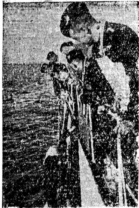
Marinarii de pe curățitoarele germane de mine cercetează marca.