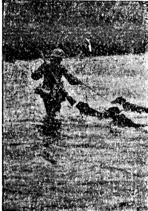
Un soldat german trecând câinii cercetași printr'o apă.

eram obligate toate trei naționalitățile de a pregăti câte un memorial și într'un timp anumit a-l comunica celorlalte două naționalități. Aceste trei memorandre trebuiau să servescă de bază lucrărilor și avea scopul de a servi de bază la desbaterea ulterioară ale conducătorilor și eventual de bază a deciziunilor congresului. Slovacii la timpul hotărât ne-au trimis memorandul făcut din partea lor pe care l'am predat imediat lui Cristea ca să pregătească și dânsul din partea noastră memorandul în chestiune.