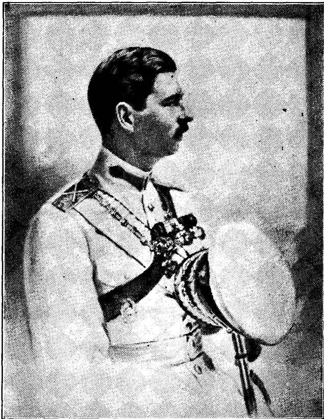
• MAIESTATEA SA REGELE CAROL II.