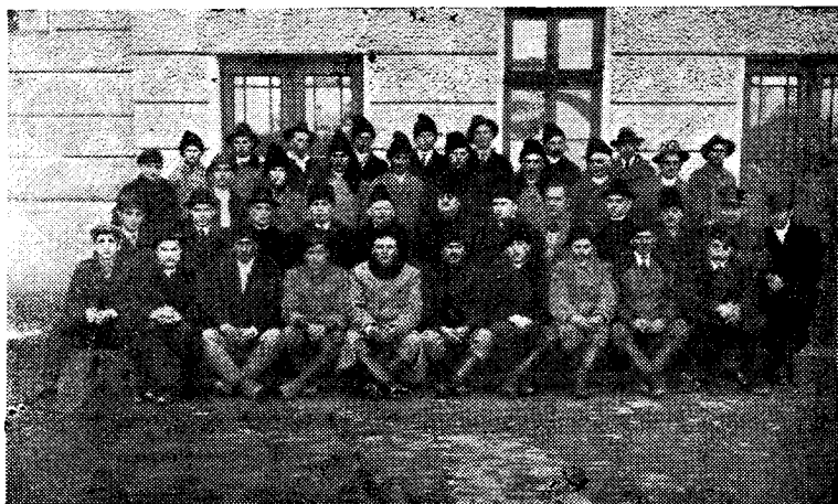
Școala țărănească din Gherla.