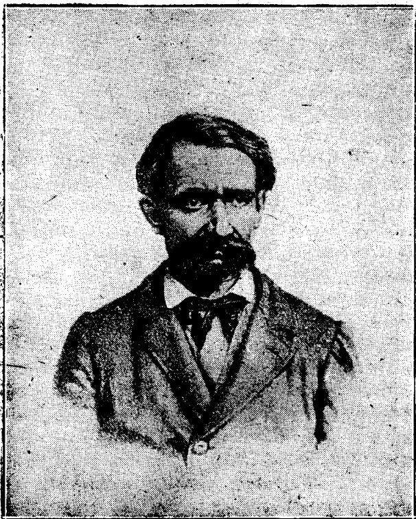
Avram Iancu în anul 1870.

vor cari se aflau pe atunci în Ardeal, — Nicolae Bălcescu, Cesar Boliac, Alecu Golescu și alții, și-au dat toate silințele ca să împace pe Iancu cu Maghiarii și apoi Iancu să treacă cu Moții săi în Muntenia, pentru a le salva situația. În 18 Ianuarie 1849 Alecu Golescu trimite din Zlatna o scrisoare mai lungă lui Iancu, la Câmpeni, comunicându-i în ea toate știrile primite