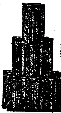
Țiglă „Bohn“ din Nagy-Kikinda.