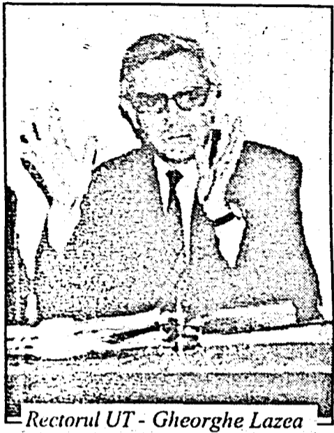
Rectorul UT - Gheorghe Lazea

Începând cu acest an și Universitatea Tehnică din Cluj-Napoca aplică sistemul de credite de studii. Studenții din anul întâi de la toate facultățile și secțiile cu învățământ de lungă durată de la UTCN vor fi obligați, de acum, să acumuleze minim 40 de credite pentru a fi promovați în anul următor. Acest sistem de acordare a creditelor funcționează deja la unele facultăți din cadrul UBB.