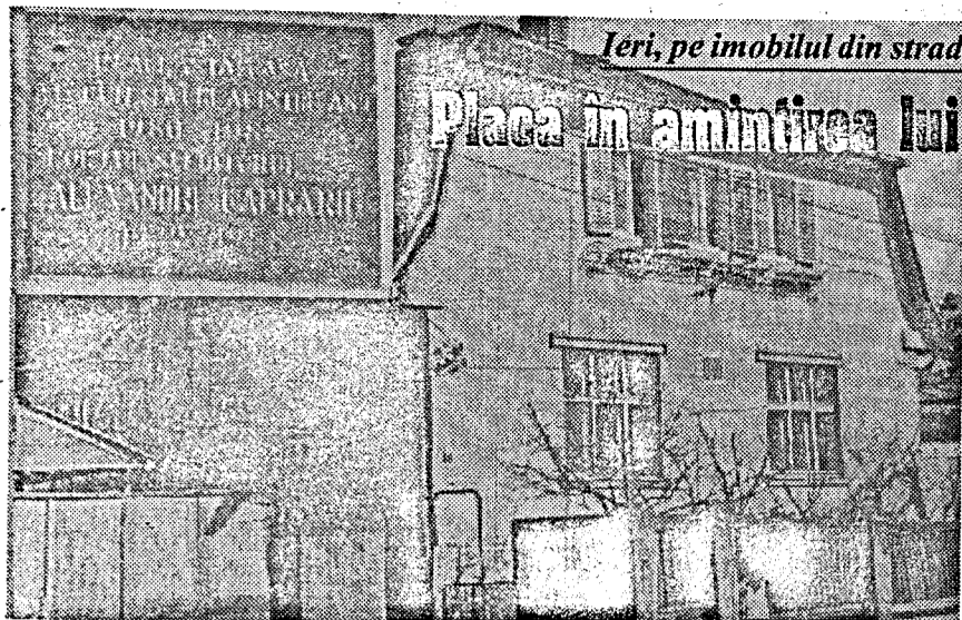
Ieri, pe imobilul din strada Braşovului nr. 5, a fost dezvelită