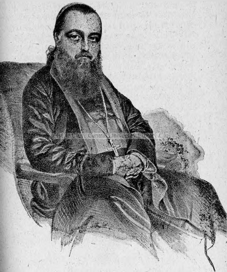
Andrei Șaguna ca vicar.