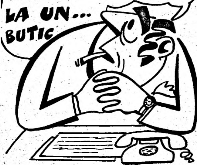
Desen de VIRGIL TOMULEȚ

ACUM, CÂND MI-AM SPORIT PUTEREA ȘI AVUȚIA, CRED CĂ E GAZUL SĂ MĂ RETRAG... LA UN... BUTIC