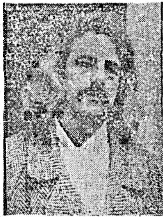
școala de pictură din Republica Moldova?

— Traversează o criză acuma. Ea s-a aflat între două culturi: slavonă și romană. Nici cadrele didactice nu sint apreciate cum trebuie. Nici pînă în prezent nu au fost. Școala trebuie să aibe o retină a ei, un specific al ei, să vină din vechi tradiții, din spiritul poporului. La Chișinău sint acuma două facultăți de pictură, deci două viziuni artistice. Pe de o parte, concepția fostei Academii din Leningrad, răspîdită pe fondul lipsei de informație din afară. Pe de altă parte, consider că e timpul să ne reîntoarcem la școala noastră, la Grigorescu, Andreescu, Tonitza, Petrușcu, Luchian, la marii maeștri. E un gol românesc foarte greu de acoperit. E un gol pe care nici nu-l poți acoperi foarte repede. E nevoie de o școală națională. Nu în sensul naționalist al cuvîntului, în sens pur artistic, românesc. Toată Basarabia e un loc favorabil creației. Îmi dau seama, ne dăm seama că vîntul bate acum dinspre Occident. Dinspre Răsărit nu mai așteptăm nimic și nici nu dorim nimic. Ne-am încercat cu prea multe vînturi și cucuie din Răsărit pentru a mai aștepta ceva.