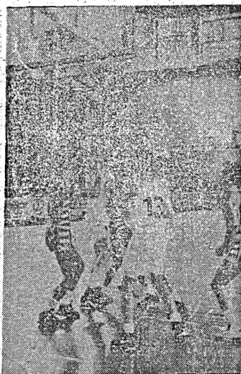
Intră, nu intră...