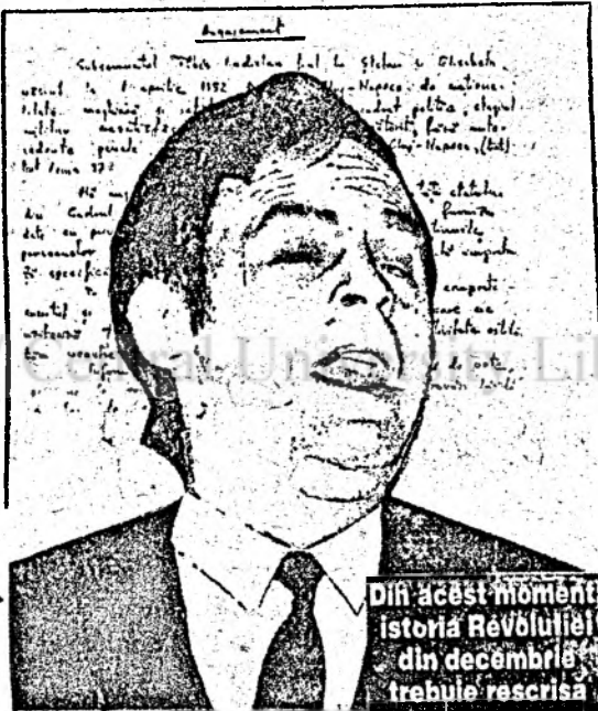
Din acest moment istoria Revoluției din decembrie trebuie rescrisă

În urma publicării articolului „Laszlo Tokes nu e un episcop real” (Tinerama nr 178 din 13-19 mai 1994), în care avansam ideea că excelența sa este un protejat al regimului Iliescu și prin toate gesturile sale antiromânești face, de fapt, jocul Puterii, am primit la redacție un comunicat din partea Oficiului Episcopal al Eparhiei Reformate de pe lângă Piatra Craiului referitor la diversiunea internă din cadrul bisericii. Întru cât acest comunicat are șapte pagini și a fost integral publicat în cotidianul de limbă maghiară „Romaniai Magyar Szó” nr. 1343 din 27 mai, noi publicăm numai un singur pasaj pe care îl considerăm relevant. Nu înainte de a menționa că acest comunicat nici măcar nu încearcă să lămurească problema legalității numirii ca episcop a excelenței sale Tokes Laszlo.