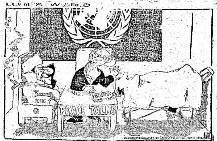
„I say - Better late than never.”

Susținătorii propunerii au apreciat însă că ridicarea embargoului va forța o reglementare pașnică și că este imoral ca musulmanii să nu fie ajutați să se apere. Un consilier al liderului democraților din Camera, David Bonior, a afirmat că aliații din cel de-al doilea război mondial tocmai au