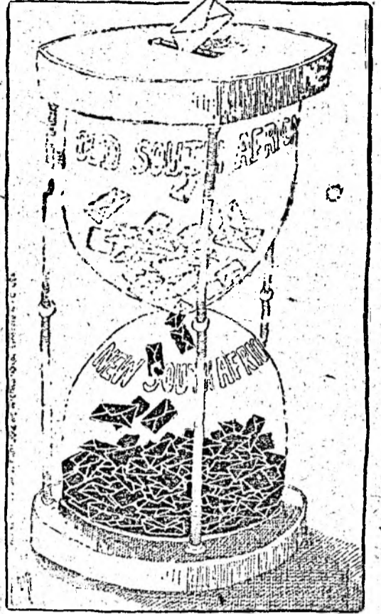
Forthcoming elections in South Africa