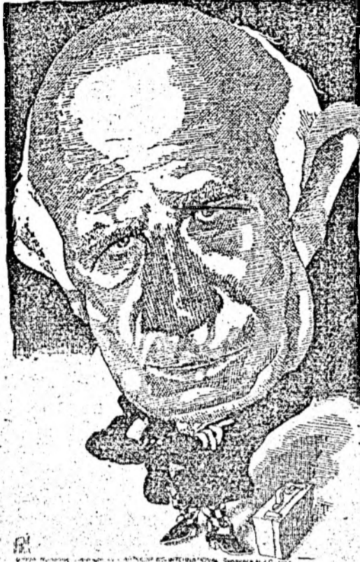
South Africa's President F. W. de KLERK