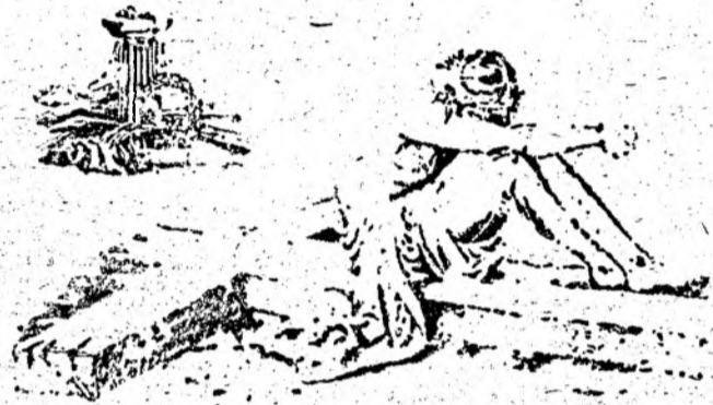
Desen de arh. Ioan ARBOREANU

Apoi, înțelegînd că jertfa mintuirii a fost dusă pînă la capăt, o pace nesfîrșită s-a coborît pe cerul înstelat al frunții Sale stînce și a rostit cu un ultim efort: „Săvîrșitu-s-a”, ca să