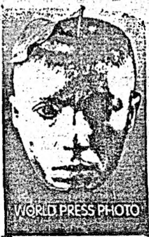
WORLD PRESS PHOTO

Ne-am obișnuit ca luna februarie a fiecărui început de an să fie cea a unui eveniment expozițional de certă valoare: WORLD PRESS PHOTO, eveniment patronat de Ambasada Olandei la București, cu sprijinul deosebit al Muzeului Național de Artă Cluj. Expoziția, în al treilea an al existenței sale clujene, a fost deschisă ieri, 23 februarie, de domnia dr. Gh. Măndrescu, din partea Muzeului Național de Artă și de apreciatul publicist Ion Maxim Danțu. Sînt prezentate publicului 60 de panouri. Dacă vreți, o selecție a selecției din peste 2000 de fotografii trimise de o asociație profesionistă care cuprinde circa 19000 de fotografii din 84 de țări. O muncă deloc ușoară pentru cei nouă membri ai juriului, prezidat de britanicul Stephen Mayes. Grupate tematice (Spot News, The Arts, General News, Daily Life, Sports, Nature and the Environment, Science and Technology), fotografiile reflectă în marea lor majoritate coșmarul lumii contemporane: foametea în Somalia și în nordul Nigeriei, victimele uraganului „Andrew”, acte teroriste în Argentina, tulburări și 58 de morți