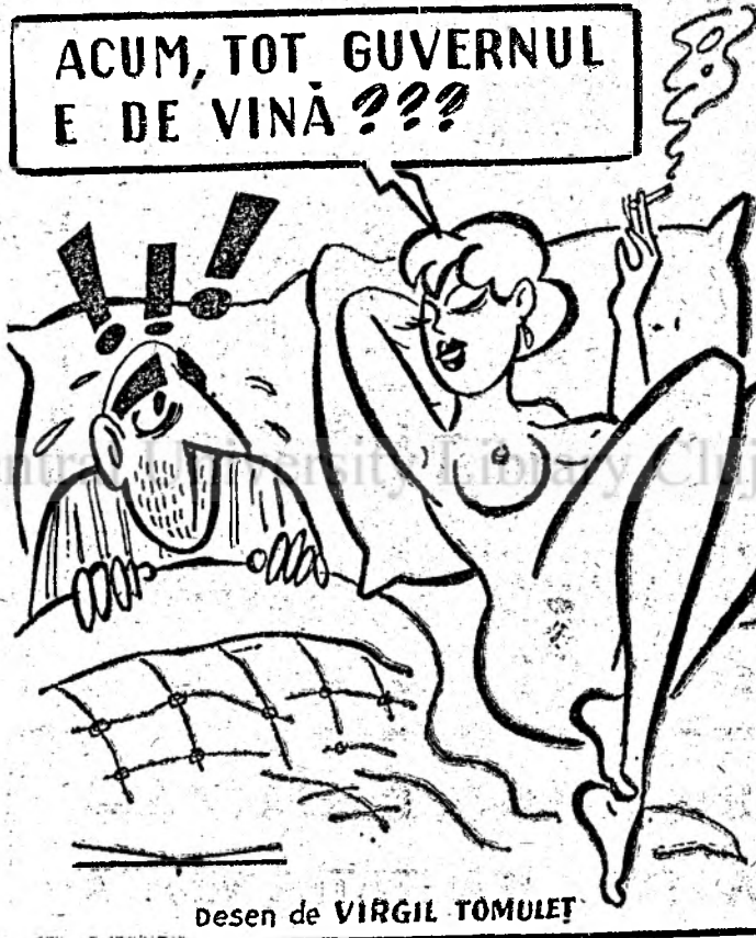
Desen de VIRGIL TOMULEȚ

În aceste zile se înregistrează la Mangalia un fenomen unic: sute de lebede, multe dintre ele de culoare gri, înșelate, se pare, de curenții calzi din ultimul timp, au ajuns pe litoralul românesc. Lipsite de hrană, acestea acceptă să iasă pe plajă, unde locuitorii ai orașului vin cu sutele să le aducă cîte ceva de-ale gurii. Lebedele primesc mîncarea direct din mina binevoitorilor. Fapt interesant, mulți entuziaști s-au constituit în grupuri care patrulează pe plajă, la distanță, pînă tîrziu în noapte, pentru a le proteja pe lebede de eventualii braconieri.