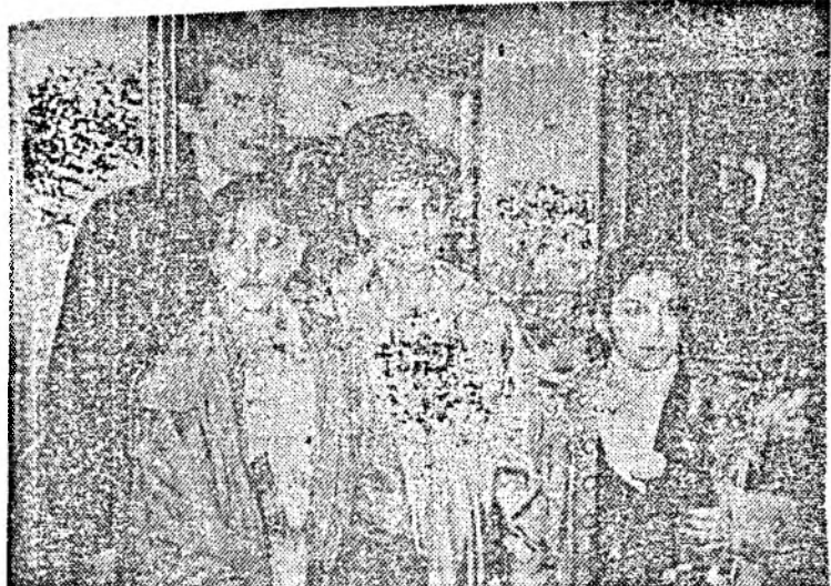
SPORTIVI DE EXCEPȚIE