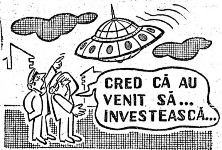
Desen de Virgil TOMULEȚ