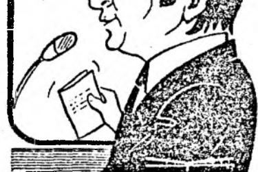
Un epigramist începător: Gheorghe FUNAR