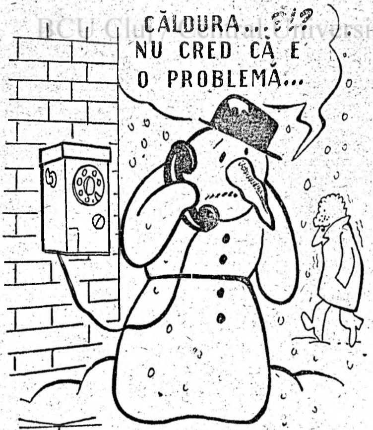
Desen de Virgil TOMULEȚ