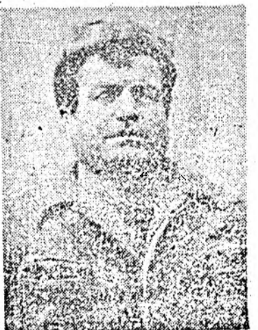
au rămas fără tată 3 copilași. Minori toți.

Nici nu mai contează împrejurările. Nici nu mai contează că totul s-a petrecut banal, în urma unor nesemnificative pînă la urmă, altercații. Mai important e că în urma acestui omor