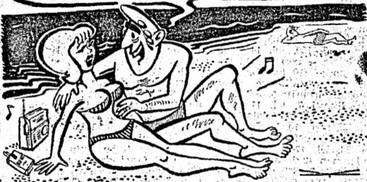
Desen de V. TOMULET