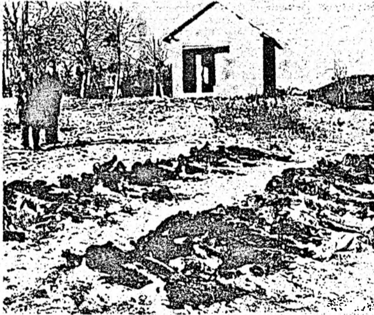
Drumurile Iugoslaviei spre Europa sînt presărate cu cadavre...