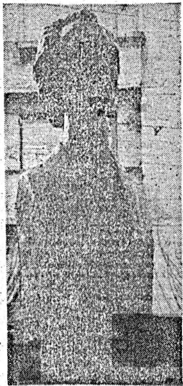
Bustul lui Eminescu la Dej