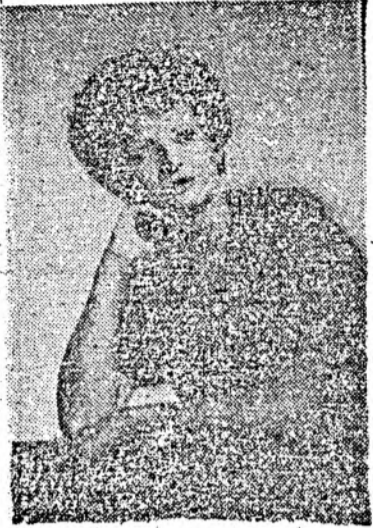
Soprana Rodica TOMA

le, manifestând o egală preocupare și pentru rolurile de operetă.