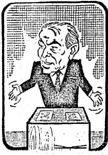
DACA LUCRURILE STAU AȘA, INSEAMNA CA INTOCMAI AȘA STAU ...