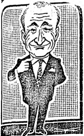
N-AM VENIT LA CLUJ-NAPOCA SA DESFIINTEZ „CARITAS“-UL ...