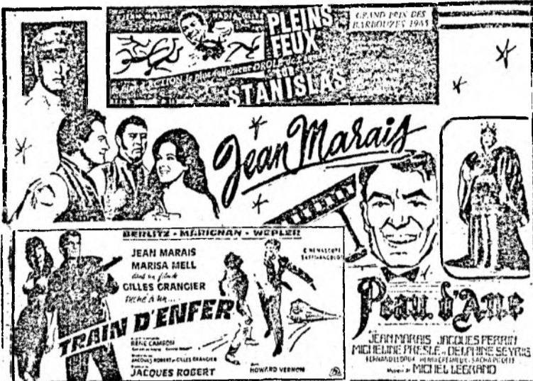
Celebru actor francez văzut de Virgil TOMULET

A fost răsplătit, de curind, cu premiul „César”, acordat pentru întreaga sa activitate cinematografică.