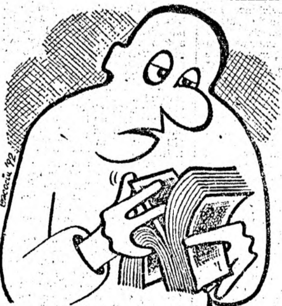
... mă prinde ... nu mă prinde ... mă prinde... Desen de Mihai BACOCIU