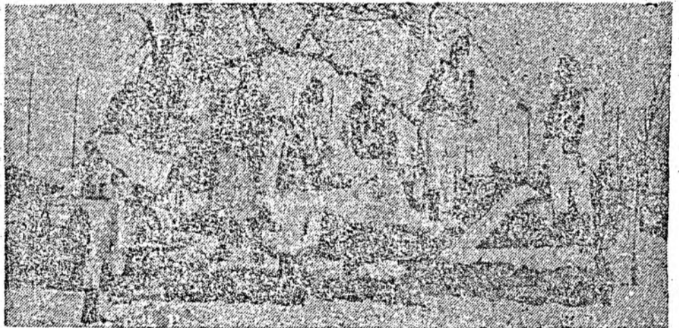
Ansamblul artistic al Jandarmăriei vă urează „La mulți ani”