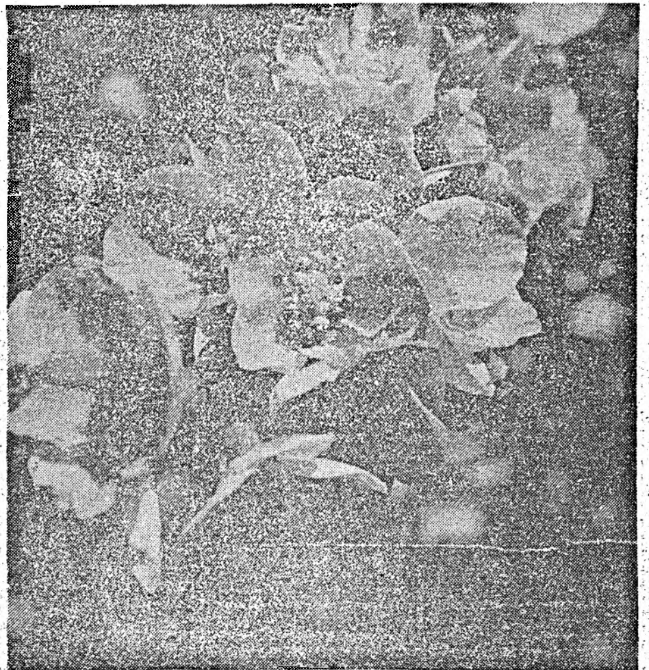
Flori de... Sfintele Florii