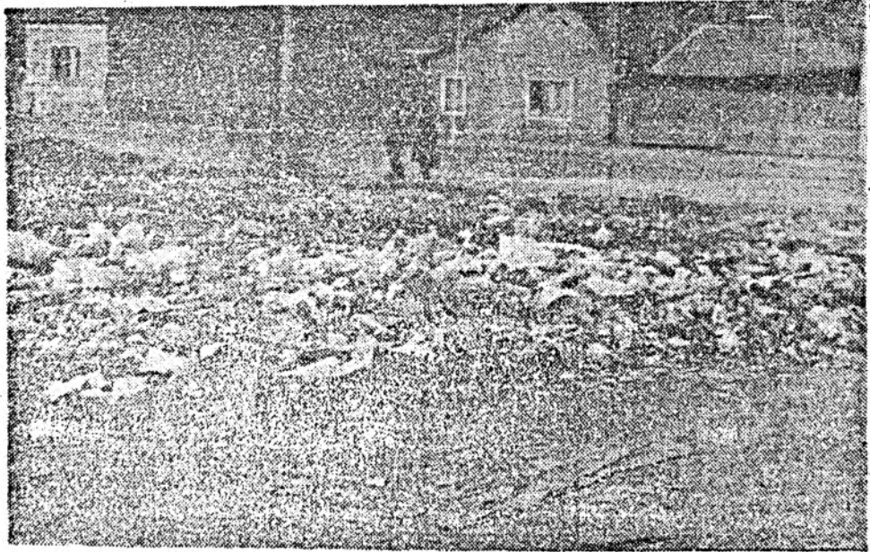
Cei răspunzători de această mizerie de pe str. Cehoslovaciei sînt invitați să privească această fotografie și să ia urgente măsuri.

Un grup de tineri, salariați ai mai multor întreprinderi clujene, care locuiesc în căminul de nefamilisti de pe strada Bufta nr. 7, se află într-o situație disperată. Despre ce este vorba? Prin adresa nr. 3315 din 21 martie 1990 a G.I.G.C.L. și adresa nr. 2432 din aceeași dată a I.P.E.G. Cluj se spune: „Vă facem cunoscut că în baza deciziei nr. 65 a Primăriei județului Cluj clădirea din str. Bufta, nr. 7 a trecut din patrimoniul G.I.G.C.L. Cluj la I.P.E.G. Cluj, această clădire primind o altă destinație. Vă solicităm să eliberați urgent camera pe care o ocupați deoarece urmează ca din 28 martie clădirea să intre în reparație capitală. Vă precizăm că s-a luat legătura cu fiecare unitate unde lucrați și acestea ne-au trimis în scris că vă asigură cazarea în căminele lor iar pentru cei care nu au această posibilitate li se va asigura cazarea la că-