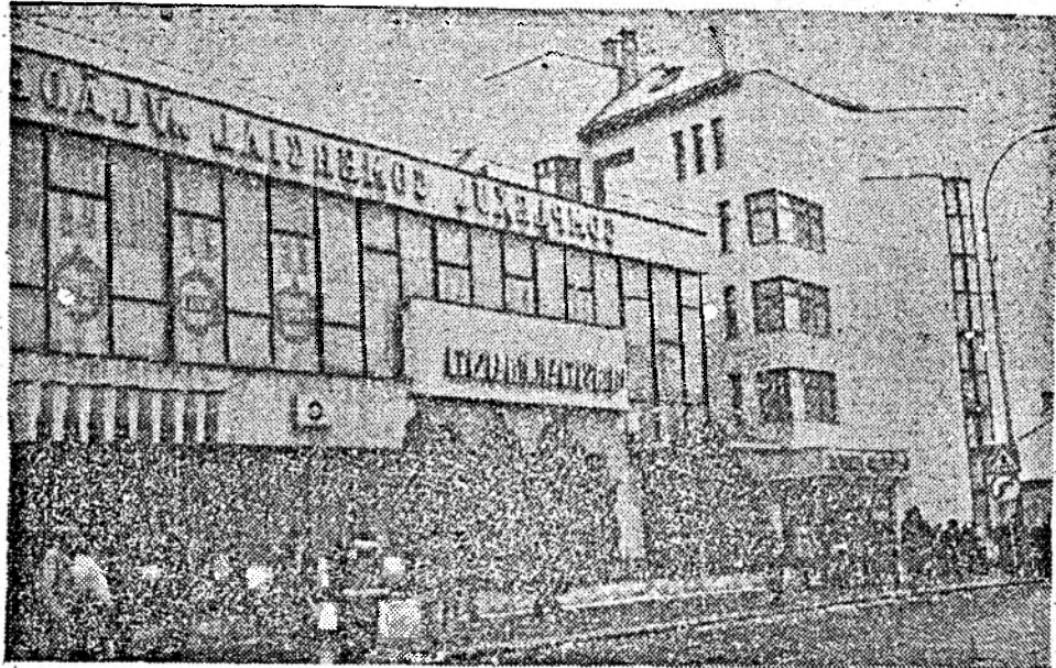
Ați mai fost prin Huedin?

Știm că în procesul înnoirii conductelor de com-promise au fost luate măsuri și la G.I.G.C.L. Se pare însă că odată cu oamenii nu au fost schimbate și năravurile.