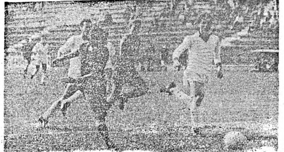
V. Iepure marchență și 2-0 pentru Steaua C.F.R.

★ P.S. În alcătuirea clasamentului, după etapa a II-a a returului a intervenit un „amendament”, în sensul că echipele ce stau și care în etapele respective ar fi avut de susținut întâlniri cu fostele formații excluse Victoria și F.C. Olt, primesc automat victoria cu rezultatul de 3-0 (concret: echipele Farul și Petrolul în etapa a XVIII-a, F.C.M. Brașov și „Poli” în etapa a XIX-a, Universitatea Craiova și Corvinul în etapa a XX-a, Jiul și Sportul Studentesc în etapa a XXI-a au beneficiat de victorii cu 3-0). În acest context nu mai are rost să prezentăm clasamentul adevăratului, care devine artificial într-un fel și neconcludent.