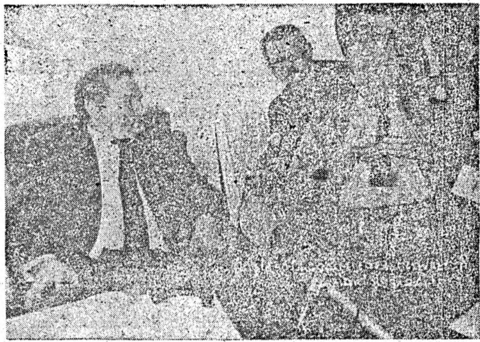
„Nobelisții” Czesław Miłosz (amețiană de origine poloneză, premiul „Nobel” pentru literatură) și Lech Walesa

L.W. — Trebuie să vă spun că privesc cu multă înțelegere către România. Această senzație mi-e cunoscută încă din 1930 — și de la noi. Desigur, pe atunci ne era cu mult mai greu — pe cîtă vreme voi aveți acum posibilități cu mult mai mari. Ați de mari încît nu ați avut timp să vă pregătiți pentru ele. Ca umare, plutește asupra voastră amenințarea anar-