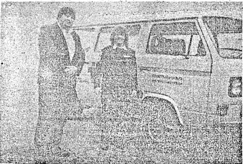
Oaspeții germani în vizită la redacția „Adevărului în libertate”