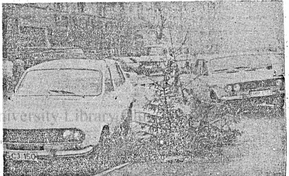
La nici 25 de metri de acest brăduț al „memoriei” s-a instalat un panou cu „Oprirea interzisă”. Nu-i pasă însă nici unui conducător auto. Cineva, nu spun cine, mi-a sugerat să dirijez pe... indisdisciplinați să parcheze în cimitir. Nu de alta, dar ar fi aceeași impietate. Căci, aici, în „Piața Libertății”, au murit oameni.