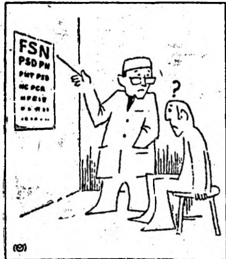
Desen de Ovidiu MARCU